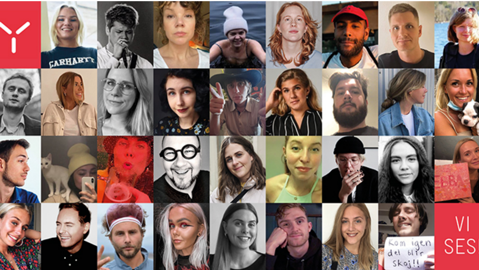
Studerande från Yrgos utbildning Art Director & Copywriter.