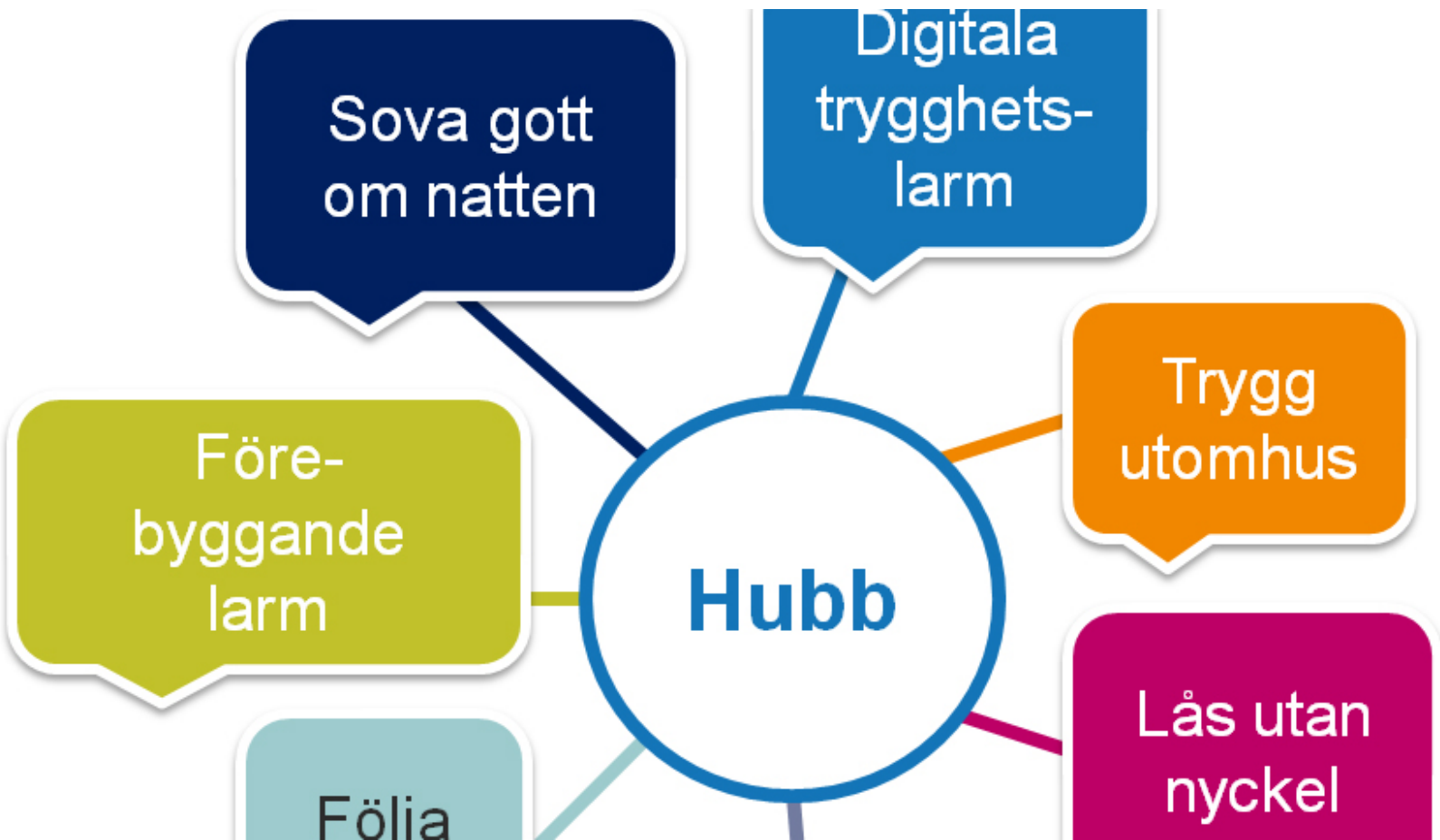
Illustrationen visar digitalt trygghetslarm och hubb som visualiserar alla tjänster som kopplas in till hubben.